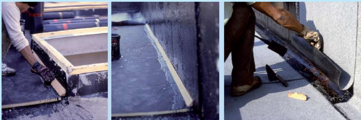
Sequenza di esecuzione di una guscia prefabbricata.

di vista tecnico. Infatti mentre la stabilità dimensionale delle armature in velo di vetro era quasi assoluta, nelle armature in NT di poliestere, per motivi di carattere produttivo, rimane sempre una leggera memoria dimensionale che può causare, nei raccordi, non perfettamente aderenti al piano di posa (spesso nelle gusce rimane un piccolo vuoto dietro alle membrane dovuto al forte spessore delle sormonte dei teli), dei distacchi delle saldature per effetto "peeling".