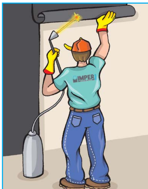
POSA IN OPERA