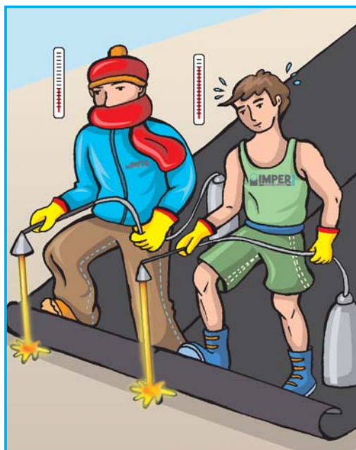
POSA IN OPERA