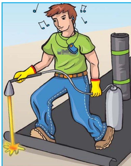
POSA IN OPERA