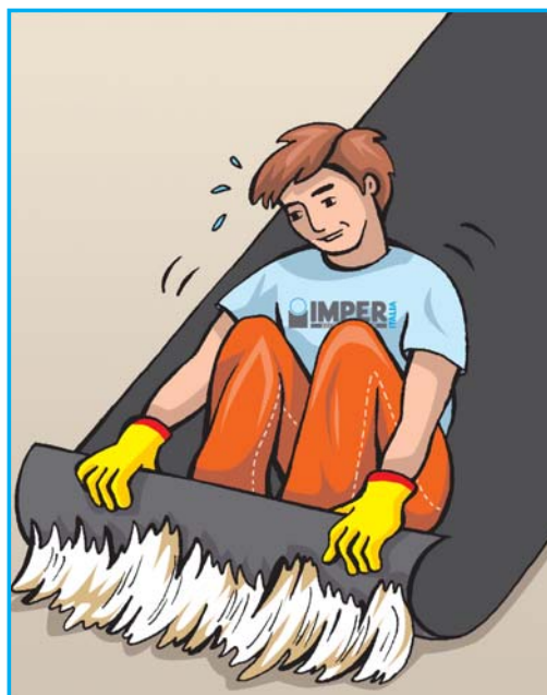
POSA IN OPERA